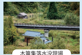
木箒集落水没現場

追加人数料金：6,000円(税込) / 30名分 (35名-20名×2台)÷5=6,000円