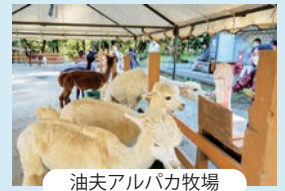
油夫アルパカ牧場