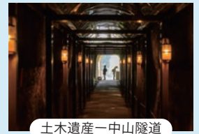
土木遺産一中山隧道