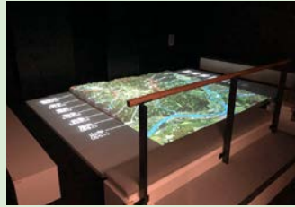
地形模型シアター

中越大震災の発災から帰村までの山古志の人々の歩みを、地形模型シアターと証言パネルを使ってスタッフがご案内します。