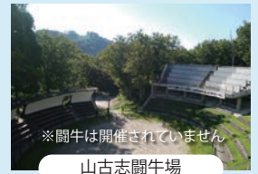
※闘牛は開催されていません